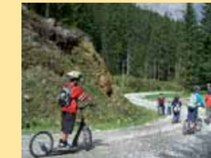
Roller am Rittisberg