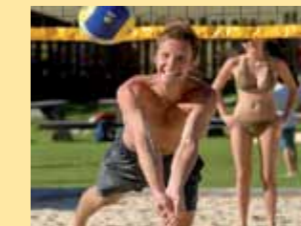
Beach-Volleyball im Freizeitpark